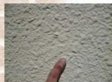
壁を触ると手が白くなる