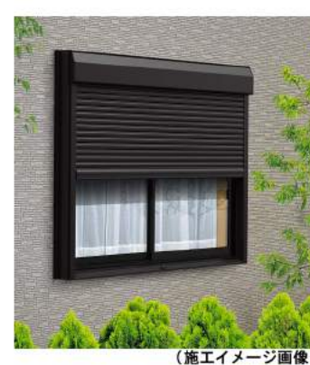
(施工イメージ画像)

雨戸からシャッター雨戸への取替えにおすすめ。外観を損なわないシンプルで美しいデザイン。