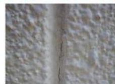
目地部分のひび割れ