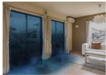
窓からの冷気侵入イメージ画像

夏に部屋が暑くなったり冬に部屋が寒くなるのは約60%の熱が窓から出入りしているためです。そのためお住まいの断熱性能は窓で決まります。断熱窓リフォームで夏は暑さを防ぎ、冬は暖かい室内の空気を逃さない、環境や家庭にも優しいエコな生活を実現します。