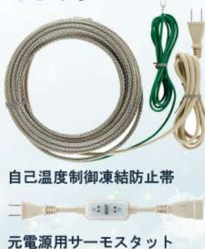
自己温度制御凍結防止帯 元電源用サーモスタット

当社おすすめ品の凍結防止用ヒーターです。 水道管に巻き付けて、発熱させることによって 水道管を凍結から守ります。 また周囲の温度を検知して自動で発熱量を調整 します。