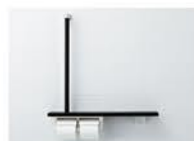
手すりの設置 補助額:5,000円