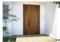
断熱玄関ドアへ取替え 補助額:30,000～45,000円