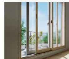
高断熱仕様の内窓設置 補助金額:84,000～30,000円

※窓・内窓・玄関ドアは商品の断熱性能やサイズによって補助金額が異なります。 ※先進的窓リノベ事業で補助額5万円以上申請する場合、こどもエコすまい支援事業は2万円以上から申請可能となります。