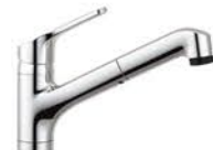
節湯水栓 補助額:5,000円