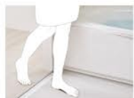
段差の解消 補助額:6,000円