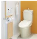
節水型トイレ 補助額:19,000円