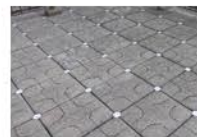
屋根の断熱工事 補助額:40,000又は20,000円