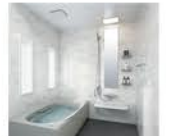
高断熱浴槽 補助額:27,000円