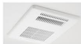
浴室暖房乾燥機の設置 補助額:21,000円