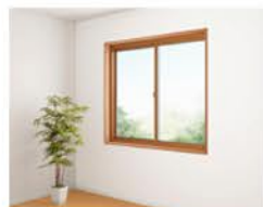
高断熱仕様の窓へ取替え 補助金額:183,000～51,000円

本事業では既存住宅の窓における高断熱リフォームに特化した補助金制度で補助額合計5万円以上から申請可能となります。