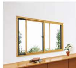
高断熱内窓の設置 補助額：76,000～22,000円