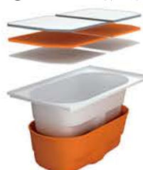
高断熱浴槽への取替え 補助額：未定