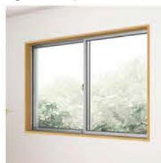
断熱サッシ取替え工事 補助額：未定