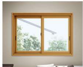
樹脂窓（カバー工法）への取替え 補助額：116,000～41,000円