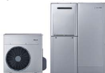
ハイブリッド給湯器取替え工事 補助額：100,000～120,000円