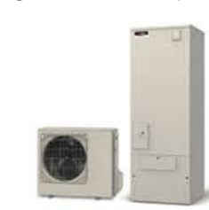
エコキュート取替え工事 補助額：70,000～100,000円