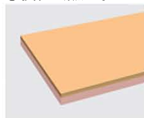
壁・天井の断熱工事 補助額：未定