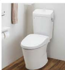
節水型トイレへの取替え 補助額：未定