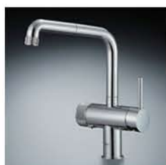
節湯水栓への取替え 補助額：未定