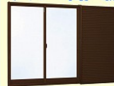
YKKAPカバーサッシ+スチール雨戸5SA サッシ・雨戸色:ブラウン

冷房の効きが悪い、結露が気になる屋外の音がうるさい……。こうした住まいの悩み、実は窓で解決できるケースが多いのです。窓の性能は住み心地を左右する重要なポイント。遮熱・省エネ・防露・防音の効果に優れた窓に変えてムダなエネルギーを使わない“スマートライフ”に切り替えてみませんか。