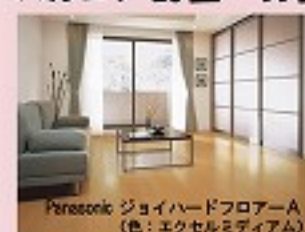
Parasonic ジョイハードフロアーA (色:エクセルミディアム)

汚れが付き難く、拭き取り易い表面仕上げ。すり傷にも強いのでワックス掛けしなくても美しさが長持ちします。