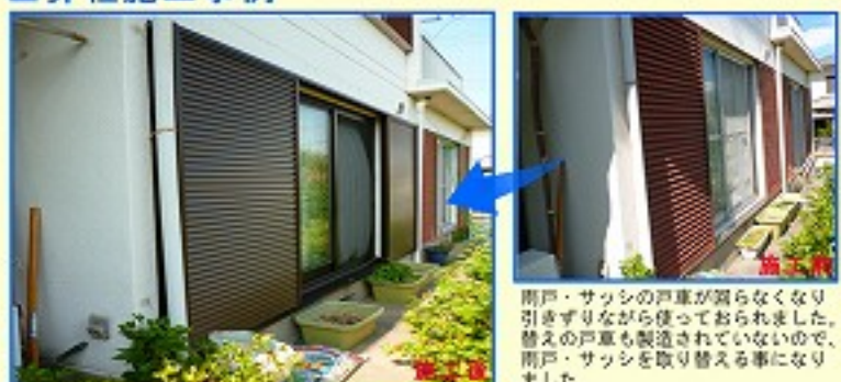
雨戸・サッシの雨戸が腐らなくなり引きずりながら使っておられました。替えの雨戸も製造されていないので、雨戸・サッシを取り替える事になりました。