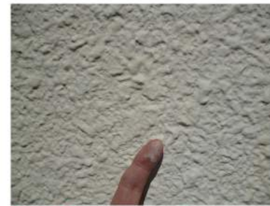
壁を触ると手が白くなる