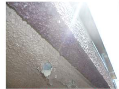
外壁塗装のひび割れ