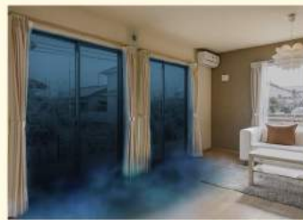
窓からの冷気侵入イメージ画像

夏に部屋が暑くなったり冬に部屋が寒くなるのは約60%の熱が窓から出入りしているためです。そのためお住まいの断熱性能は窓で決まります。断熱窓リフォームで夏は暑さを防ぎ、冬は暖かい室内の空気を逃さない、環境や家庭にも優しいエコな生活を実現します。